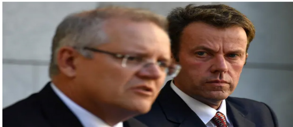
▲ Australian prime minister Scott Morrison and trade minister Dan Tehan, who says parties to the CPTPP must have a 'track record of compliance' with existing trade agreements and World Trade Organisation commitments.

Trade minister Dan Tehan wants Beijing to resume high-level dialogue with Australia