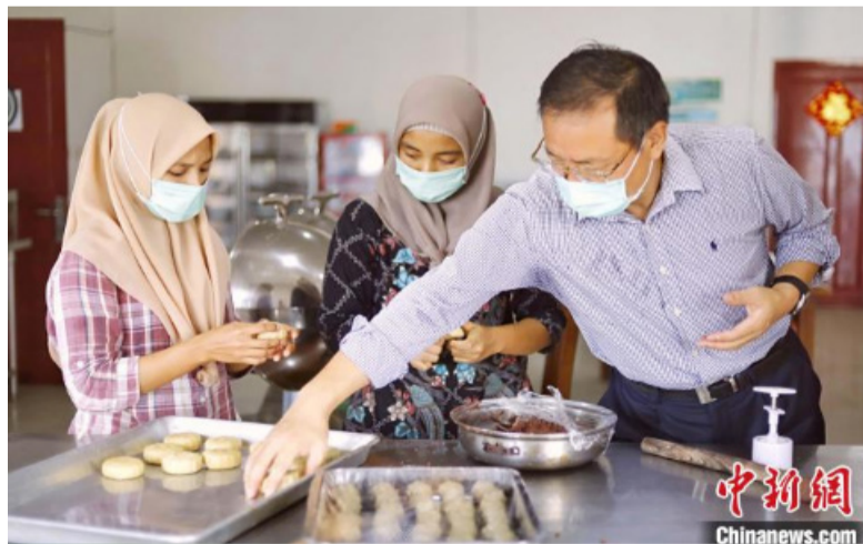
图为印尼籍员工学习做中秋月饼。

中新网印尼明古鲁9月17日电 (林永传 吕菁萌)在中国传统中秋佳节来临之际，印尼中资企业——明古鲁发电公司16日组织中印尼两国员工进行主题为“情暖中秋，共