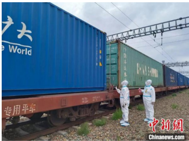
阿拉山口海关工作人员进行班列查验。

中新网乌鲁木齐9月14日电 (齐丽格尔石钰涵 陈乾)一列满载氯化聚乙烯、休闲鞋、玩具、百货等货物的中欧班列近日从新疆阿拉山口口岸驶出，这是阿拉山口海关验放的全国首列“铁路快通”出境中欧班列。