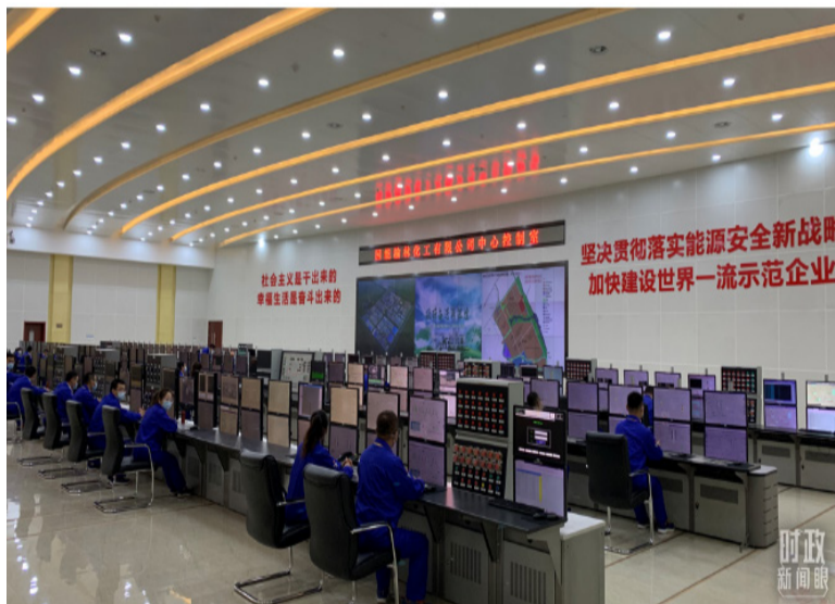
榆林化工中心控制室。