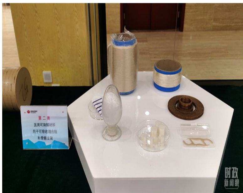
现场陈列的可吸收缝合线、骨骼支架等。