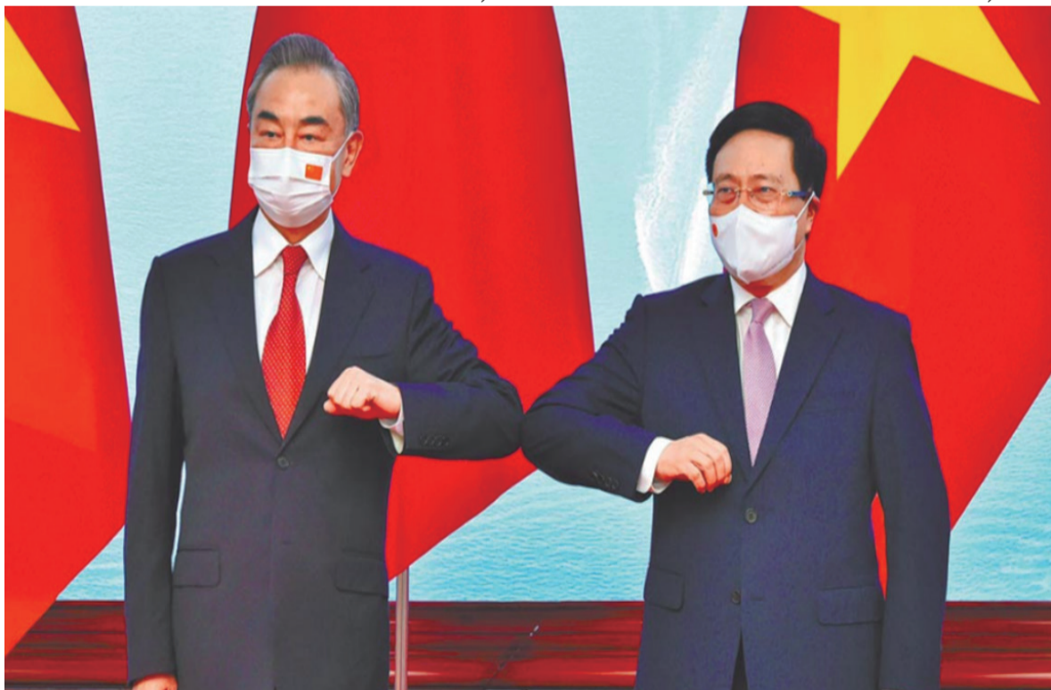
图为中国国务委员兼外长王毅（左）和越南常务副总理范平明10日共同主持「中国—越南双边合作指导委员会」第十三次会议。