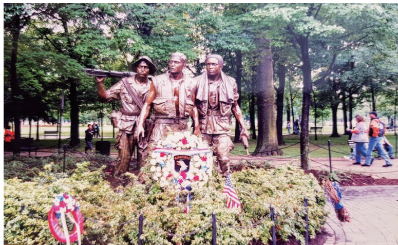
四张照片拍摄于越战纪念公园