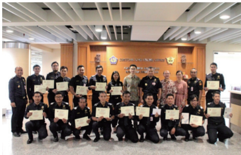
资料图：巴厘岛伍拉莱机场海关汉语培训班结业

子学院将尽可能利用好这段时间，加速培养当地懂中文的旅游汉语人才，快速提高旅游从业人员接待中国游客的中文水平和服务质量。(完)