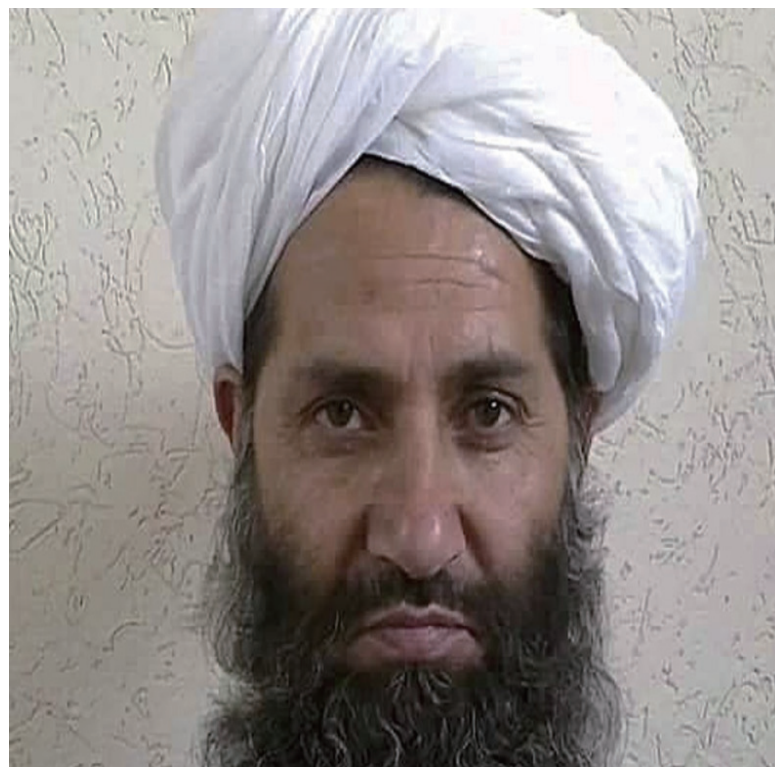
资料图：阿富汗塔利班最高领袖阿洪扎达