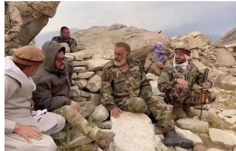
潘杰希尔反塔利班武装