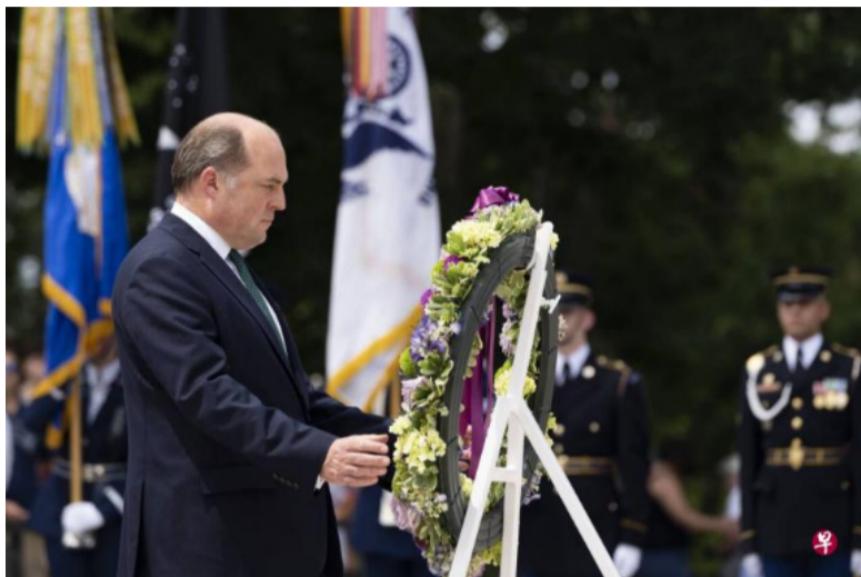
英国国防部长华莱士7月12日访问美国五角大陆，在阿灵顿国家公墓向无名烈士墓献花圈。