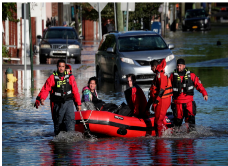
纽约暴雨,图片来源:新华社

“艾达”9月1日扫过美国东北部时,被认为已减弱为热带低压,但其威力和造成的损失让人始料不及。此前,气象部门预报当地有降雨,却鲜有关于降雨强度的信息,直到晚9时纽约居民才收到美国国家气象局发布的洪灾预警。