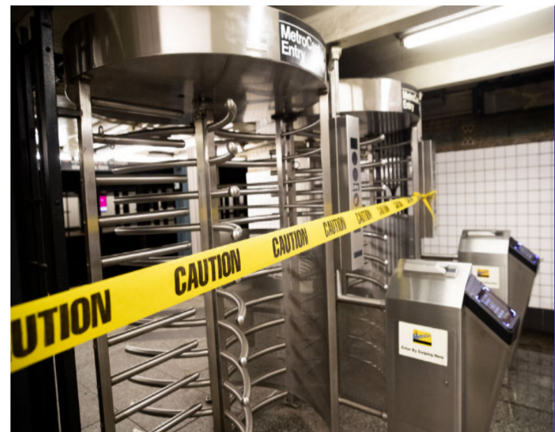
9月2日,美国纽约一个地铁站因积水关闭。