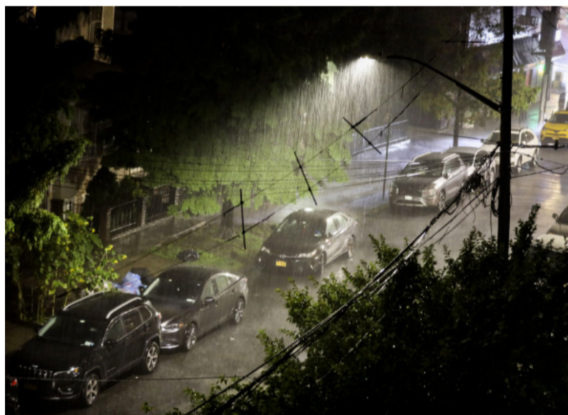
纽约暴雨