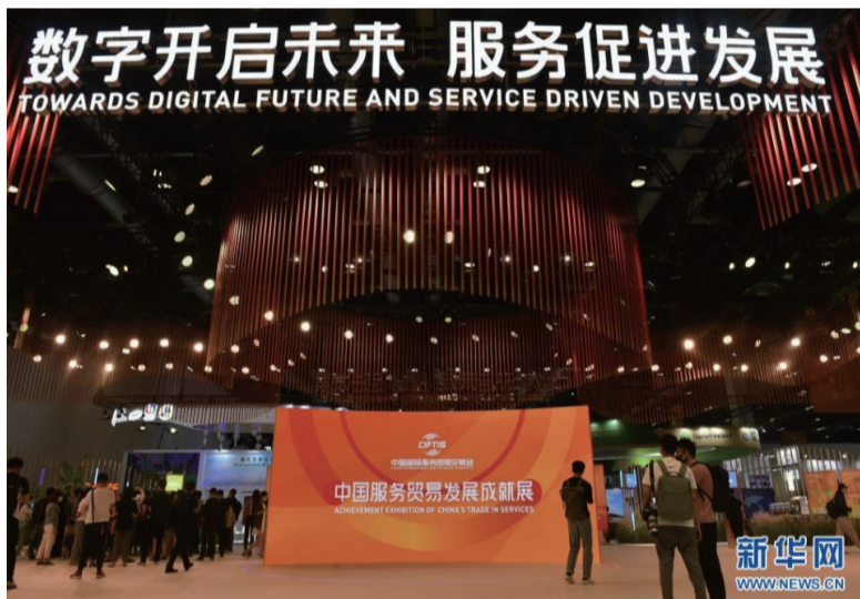
8月31日，媒体记者在2021年中国国际服务贸易交易会国家会议中心展馆内探访。