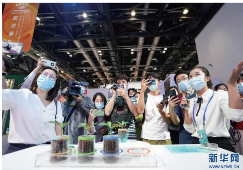
8月31日，媒体记者 在国家会议中心展馆内探访。