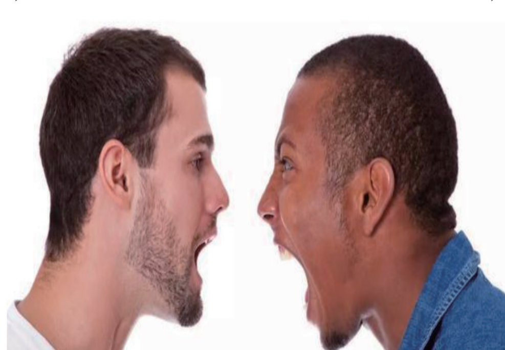
美国种族歧视严重