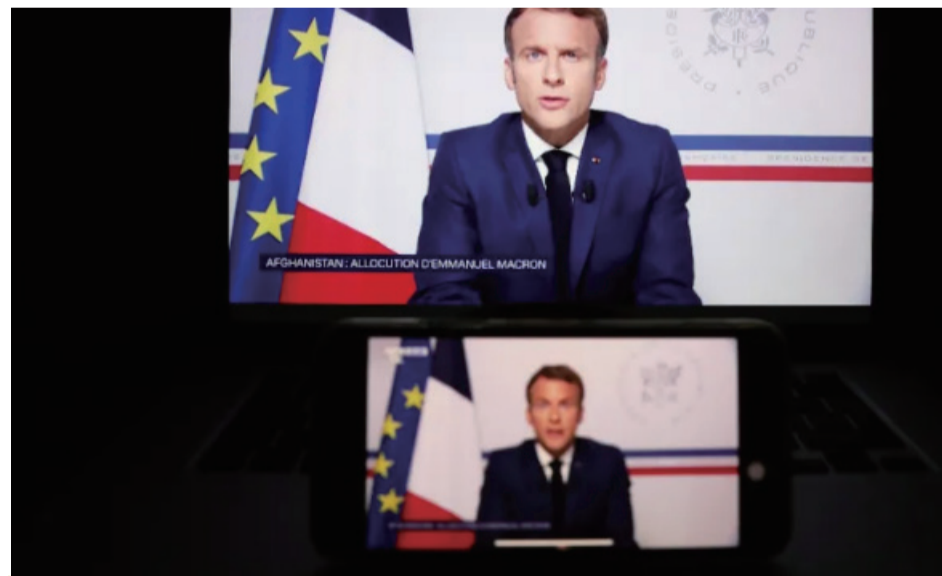
这是8月16日在法国巴黎拍摄的法国总统马克龙就阿富汗局势发表电视讲话的直播画面。