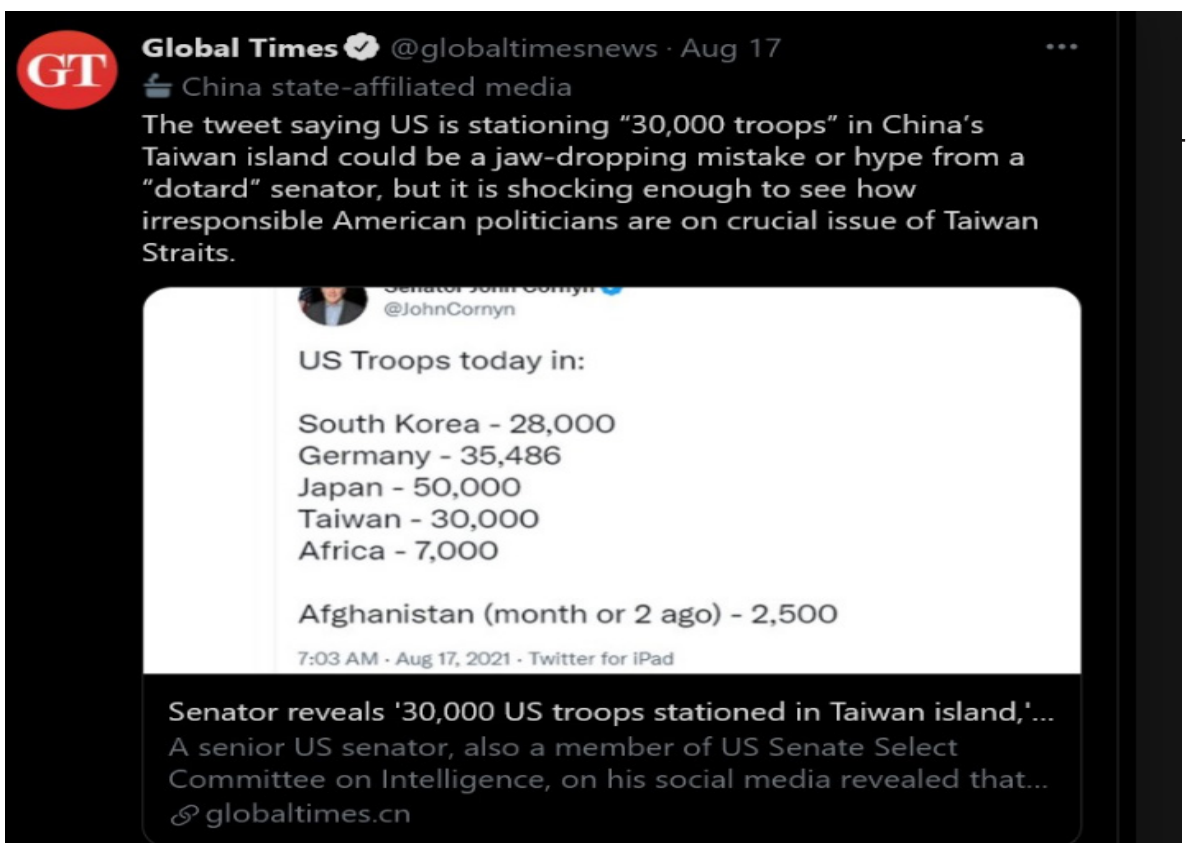
《环球时报》国际版当天在推特发文说，科宁的足以让人看到美国政客在台湾海峡的关键问题上是多么不负责任。（网络截图）