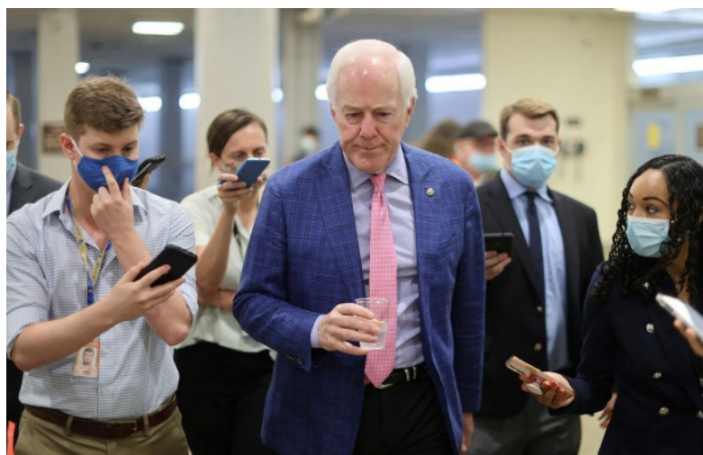
今年69岁的科宁是来自德克萨斯州的美国联邦参议院共和党籍资深参议员。