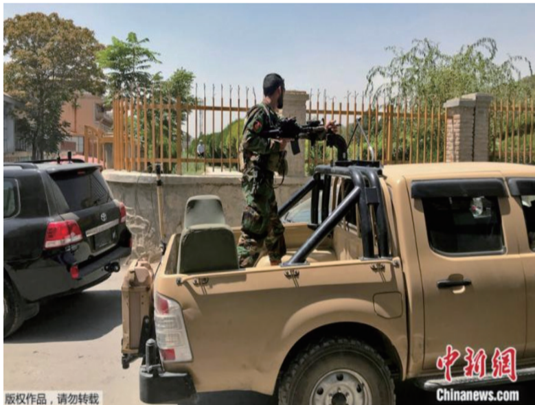
2021年8月15日，阿富汗喀布尔街头的阿富汗军人。