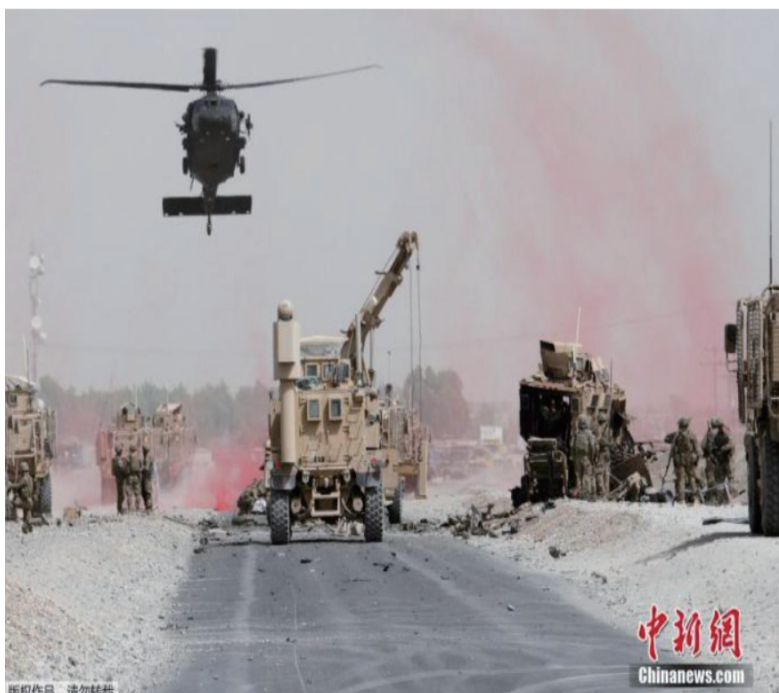
资料图：驻阿富汗美军部队。