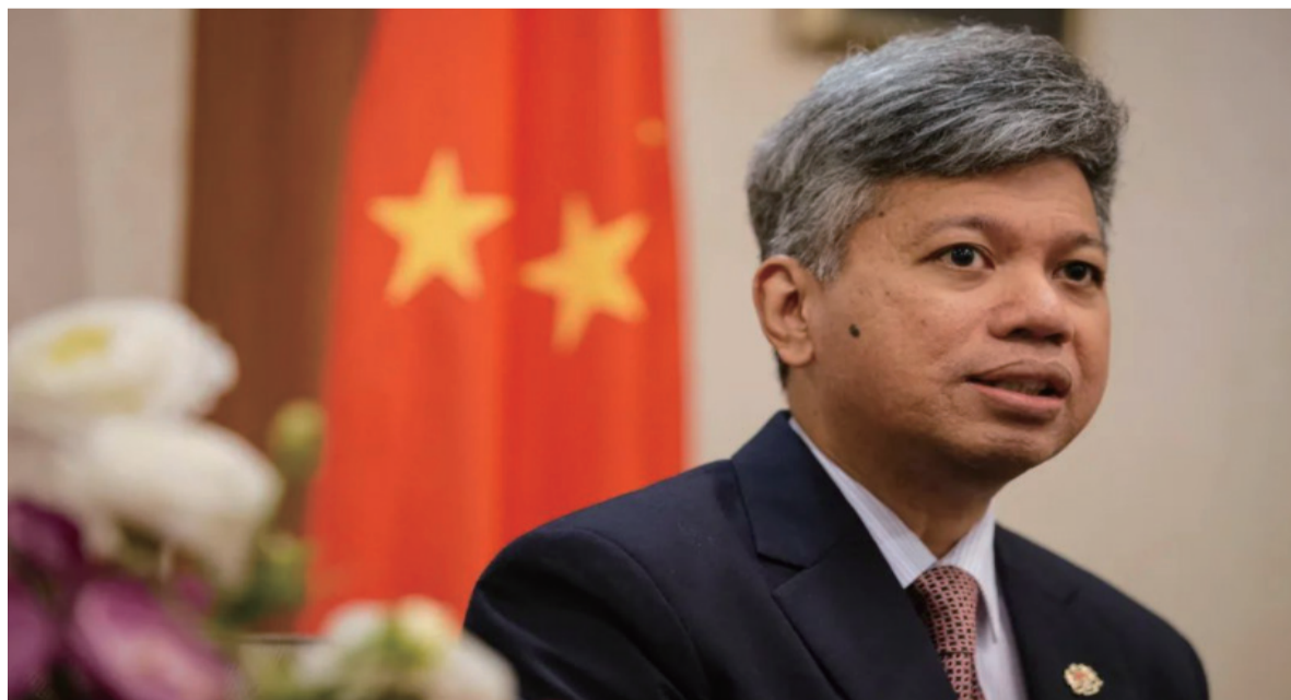
马来西亚驻华大使怒西尔万