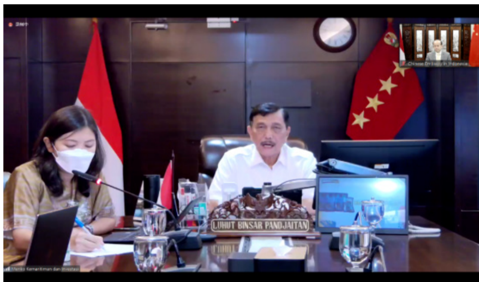
印尼海洋与投资统筹部长卢胡特