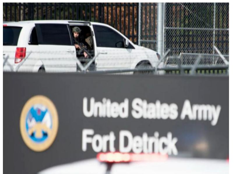
资料图片：4月6日，特警人员准备进入美国马里兰州弗雷德里克市的德特里克堡军事基地。