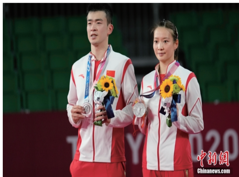
图为郑思维和黄雅琼一起登上领奖台。

决赛中，两对组合奉献了一场高质量的比赛，也为中国代表团又添一金一银，中国羽毛球选手，好样的！