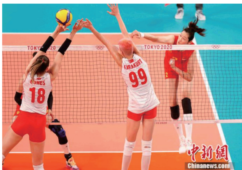
朱婷在比赛中扣球。