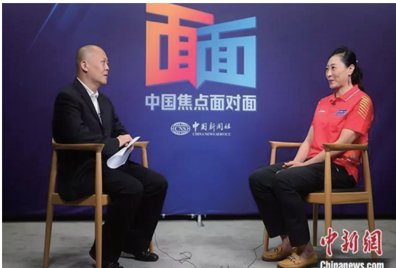
中新社“中国焦点面对面”专访雅典、北京两届羽毛球奥运冠军、世界羽联名人堂成员张宁。