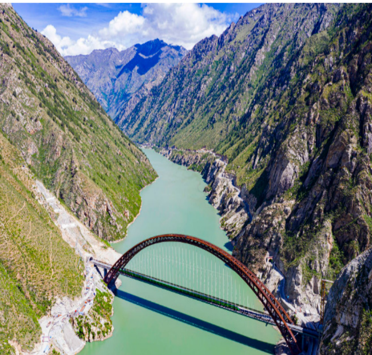
试运行的“复兴号”列车行驶在藏木特大桥（2021年6月17日摄，无人机照片）。