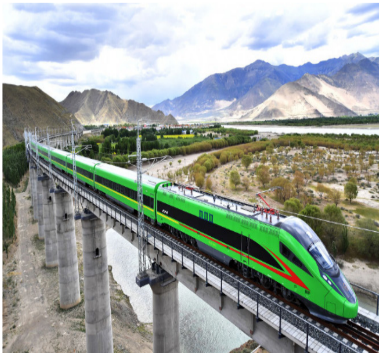
试运行的“复兴号”列车行驶在西藏山南市境内（2021年6月16日摄）。