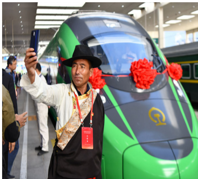
乘坐拉林铁路首班列车的乘客在拉萨火车站与“复兴号”自拍合影（2021年6月25日摄）。