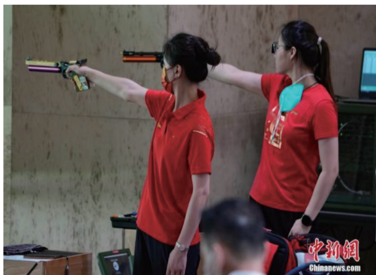
7月21日，日本东京奥运会射击馆，中国射击队运动员在进行赛前训练。