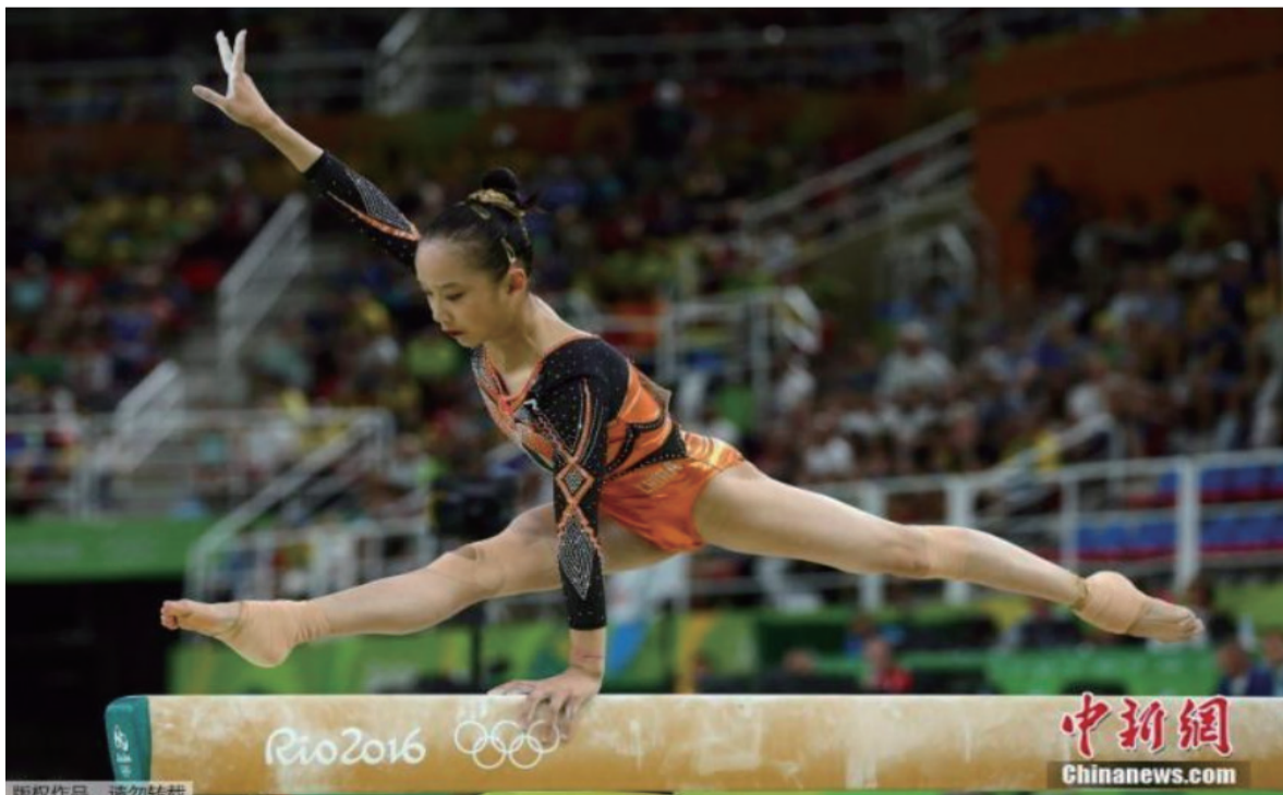
资料图：范忆琳在里约奥运会平衡木比赛中。

的夺牌大户。经历过里约奥运的至暗时刻后，这支颇具实力和天赋的中国体操队期待在东京重返最高领台。东京奥运会的体操比赛将在7月24日拉开大幕，我们一起为中国体操队加油。（完）