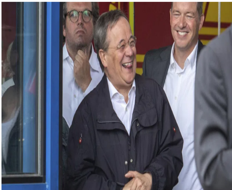
阿明 ● 拉舍特被拍到在施泰因迈尔受访时说笑

当地时间7月17日，德国总统施泰因迈尔视察灾情严重的北莱茵-威斯特法伦州埃夫特施塔镇（Erftstadt），身为该州州长的拉舍特陪同在旁。据欧洲新闻网网站“the local”德国版报道，在施泰因迈尔向媒体表达对灾民的同情