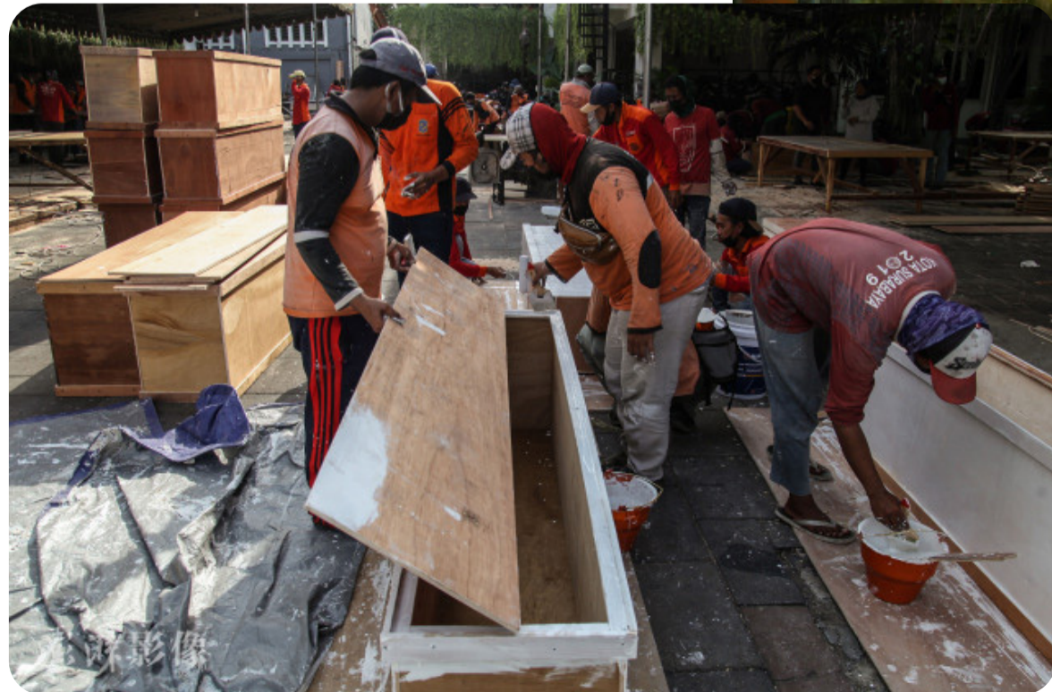
当地时间7月3日，印尼东爪哇省泗水，新冠疫情严峻，工人为新冠死者赶制棺材。