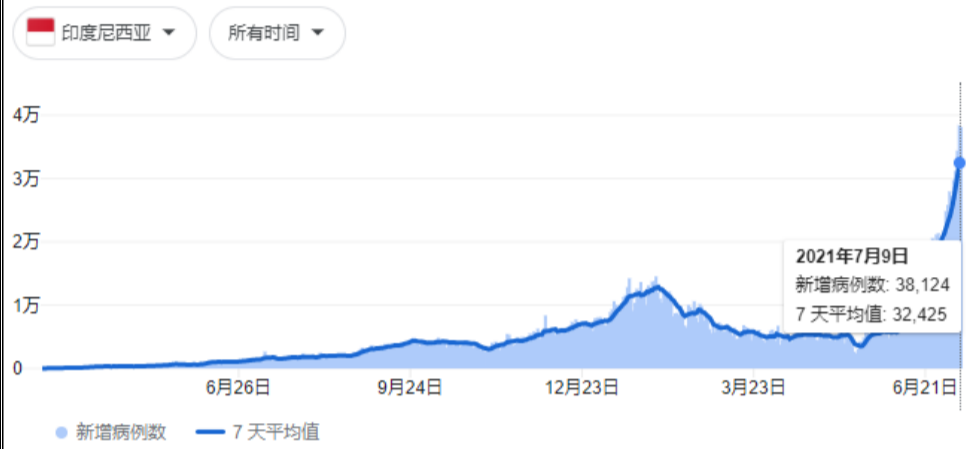
印尼疫情趋势图

随着印度尼西亚冠病疫情恶化，新加坡政府从现在开始将减少批准非新加坡公民与永久居民入境。