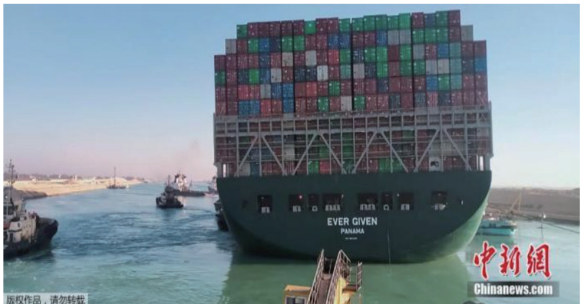
资料图：搁浅在苏伊士运河中的“长赐”号成功起浮。