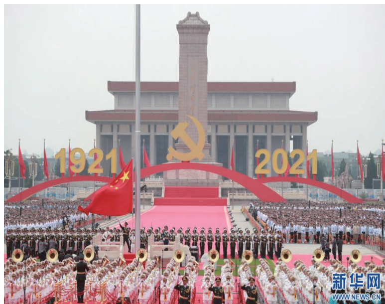
7月1日上午，庆祝中国共产党成立100周年大会在北京天安门广场隆重举行。这是升国旗仪式。

需要明白的是，中共将不得不在日益复杂的国际形势下实现既定目标。越来越多的迹象表明，中国将不可避免地与美国竞争。如今，就像几十年前一样，中共必须在实践中证明，它有能力动员全国取得新的成就和胜利。