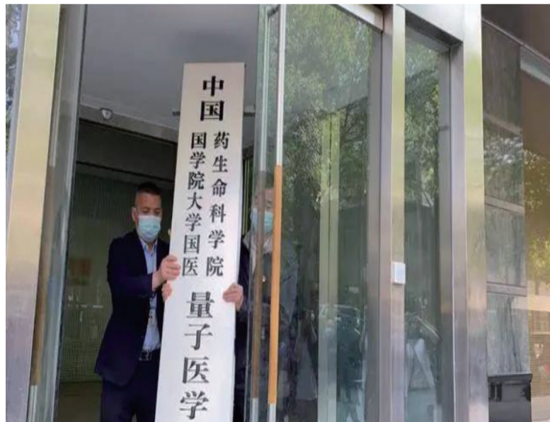
中国国学院大学 “野鸡大学”被摘牌

民政部表示, 将对非法社会组织持续保持高压打击态势, 加强网络监测与排查, 线下线上同步查处, 坚决铲除其滋生土壤。