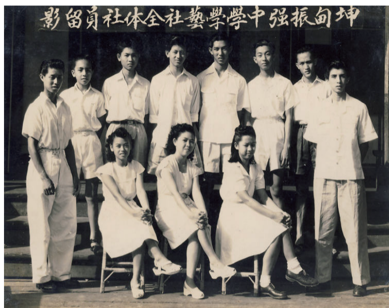
学艺社全体社员合影