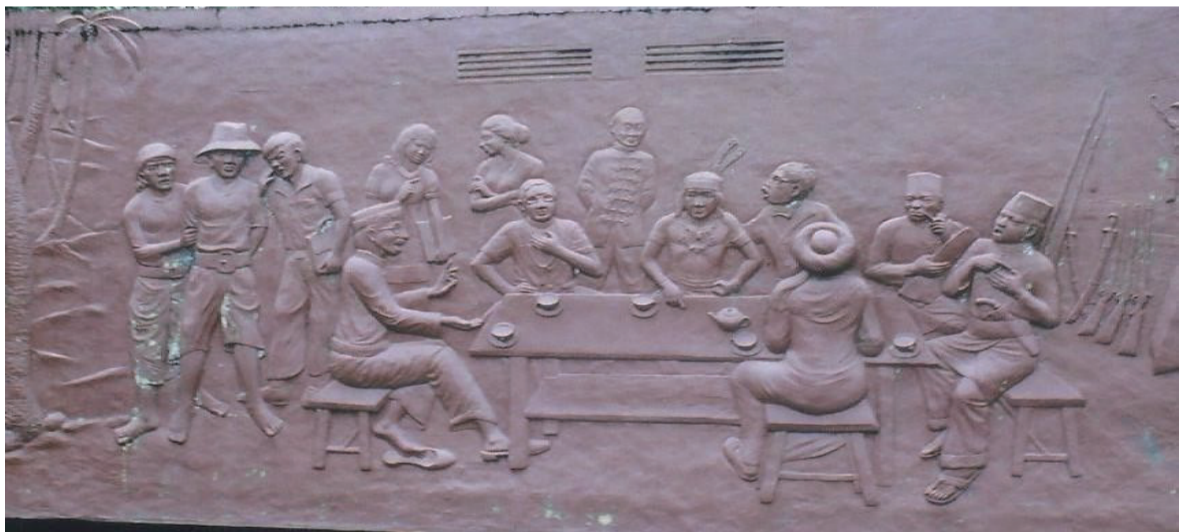
服饰和穿戴可知，是华侨、马来及达雅族，合议反抗日本。