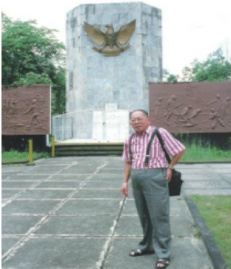
纪念园中的纪念碑， 两边共长30米