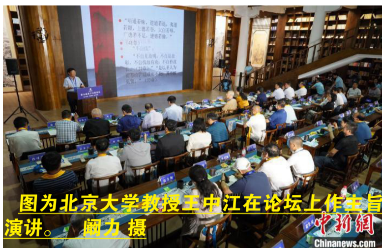
图为北京大学教授王中江在论坛上作主旨演讲。