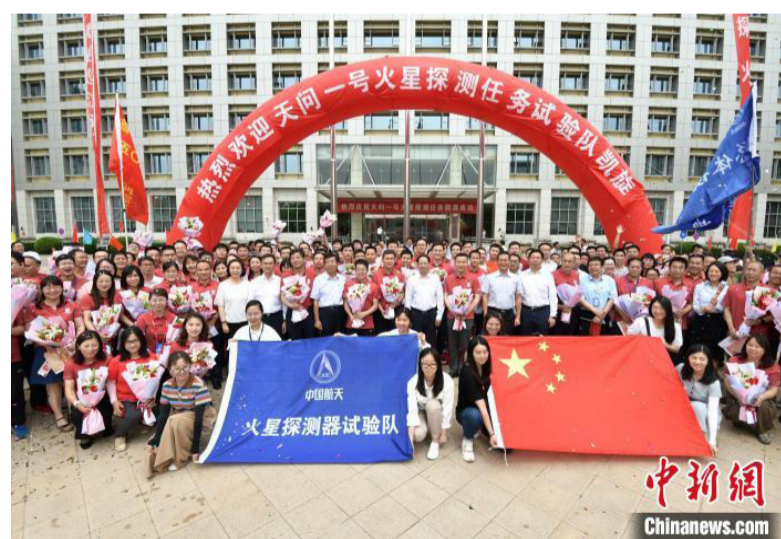
6月11日，航天科技集团五院举行欢迎活动，迎接天问一号火星探测任务试验队凯旋。

五院相关负责人表示，我国首次火星探测任务于2016年正式批复立项，计划通过一次任务实现火星环绕、