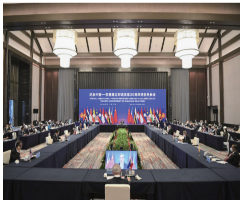
6月7日，纪念中国—东盟建立对话关系30周年特别外长会在重庆举行。