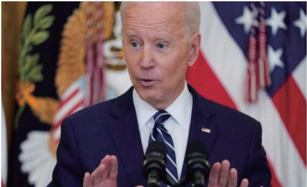
资料图：美国总统拜登。