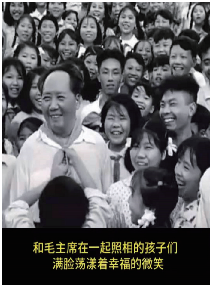
和毛主席在一起照相的孩子们 满脸荡漾着幸福的微笑