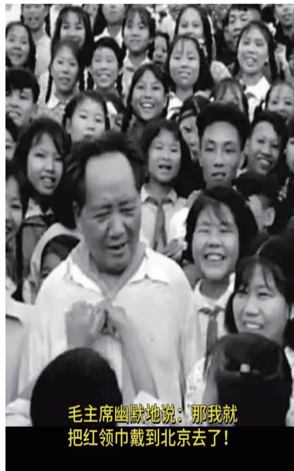
毛主席幽默地说：那我就 把红领巾戴到北京去了！