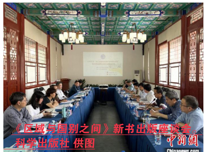
《区域与国别之间》新书出版座谈会。

机,北大历史学系筹划了这套“海上丝绸之路与区域历史研究丛书”,《区域与国别之间》列为丛书首部出版,“正式开启了北大历史学系海上丝绸之路的远航”。