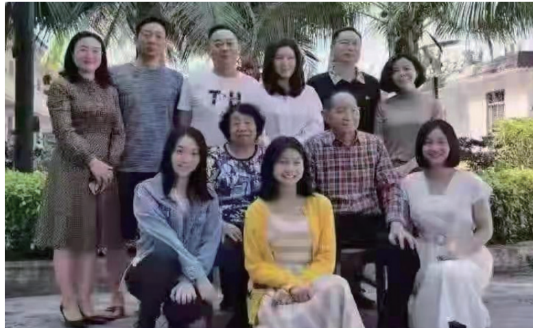
今年春节，袁隆平今年在海南三亚拍摄的全家福，三个儿子与媳妇，前面是三个孙女。