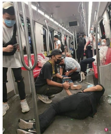
吉隆坡轻快铁两列车不知何故发生碰撞 造成多名乘客受伤困在车厢内