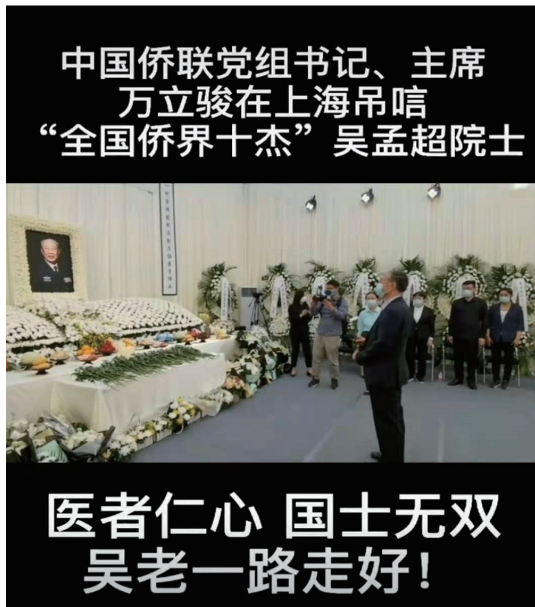
中国侨联党组书记、主席 万立骏在上海吊唁“全国侨界十杰”吴孟超院士