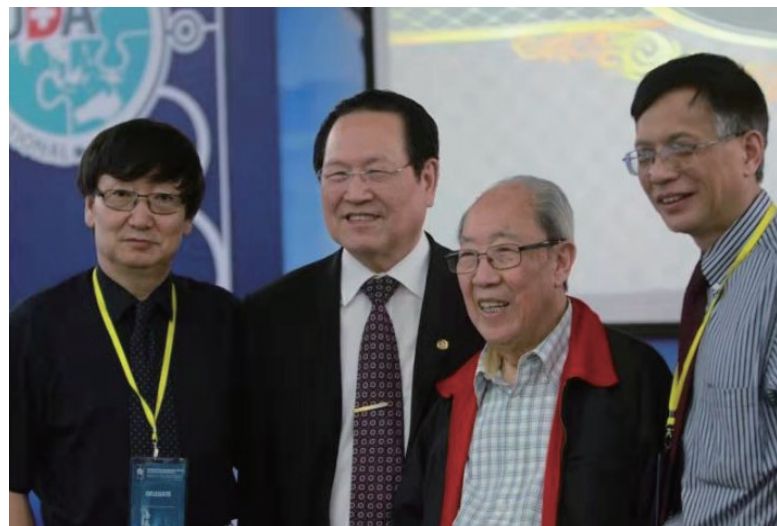
吴孟超院士与徐克成合影