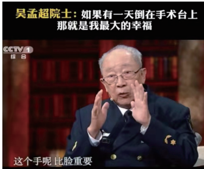
吴孟超院士：如果有一天倒在手术台上 那就是我最大的幸福