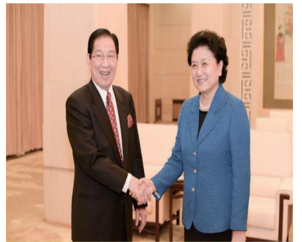
颁奖后刘延东副总理和杨兆骥亲切握手