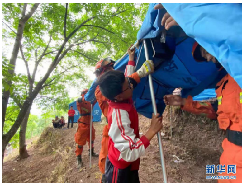
5月22日,在云南漾濞地震灾区,一名学生帮助消防官兵搭建救灾帐篷。

据介绍,地震使漾濞县受灾群众的房屋和生产设施严重受损。据初步统计,目前倒塌房屋192间,一般损坏13090间。道路交通方面,大保高速顺濞段中断2处(暂未抢通),320国道顺濞段中断1处、县乡村道中断6处(正在抢通),桥梁受损3座;水利基础设施方面,水池水窖受损1073个、人饮工程受损45件135公里、水库