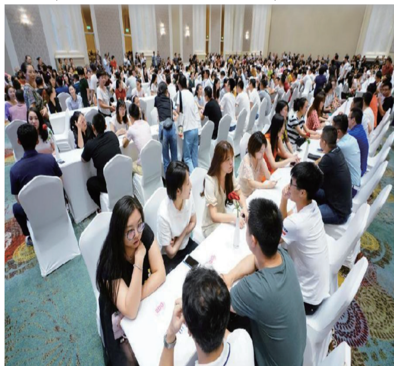
（2018年8月12日，河北省唐山市举办第二届京津冀单身青年相亲大会，来自京津冀三地近千名单身青年男女参加。）