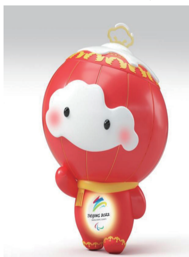
北京2022年冬残奥会吉祥物 雪容融