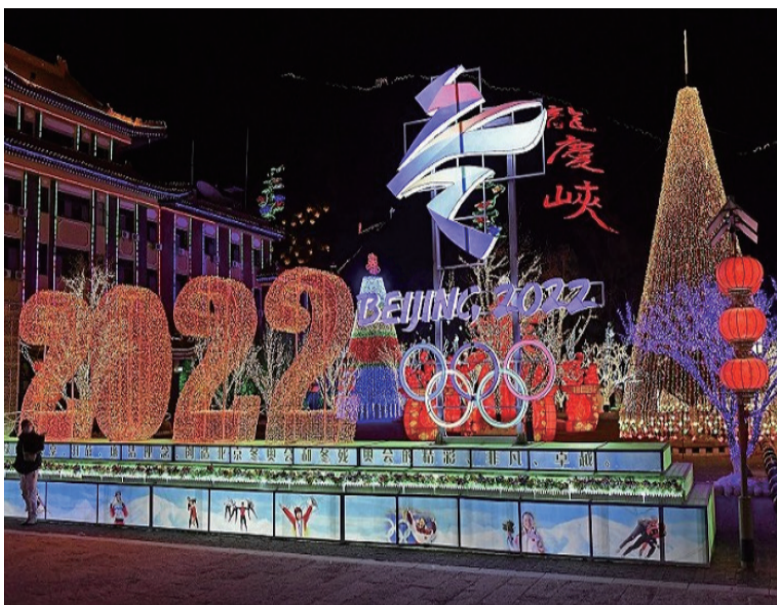
2022年北京冬奥会