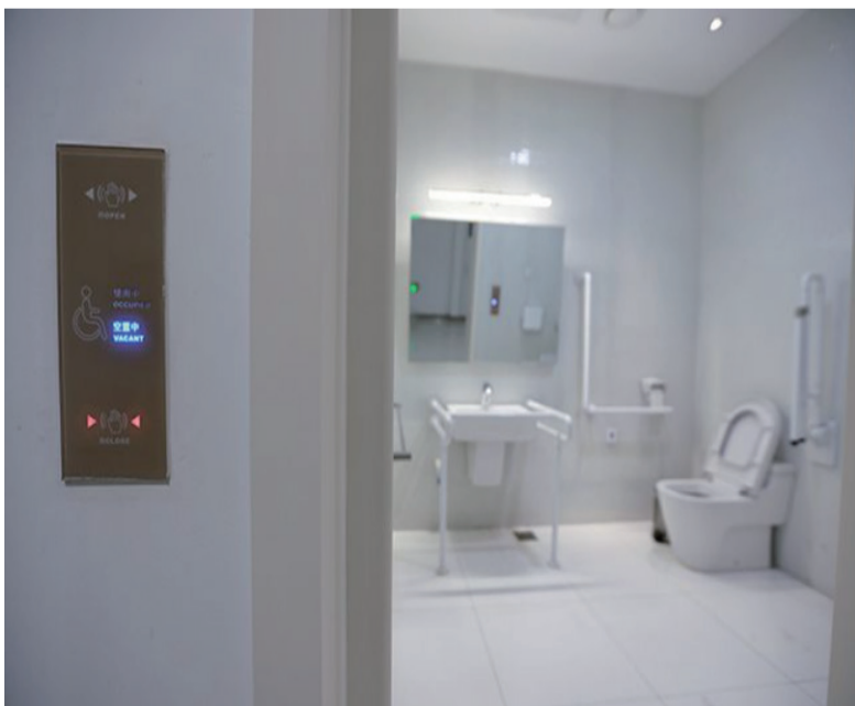
国家游泳中心无障碍卫生间

北京冬残奥会所有竞赛场馆全部完工 无障碍设施建设同步实现完工；非竞赛场馆建设、改造工作稳步推进