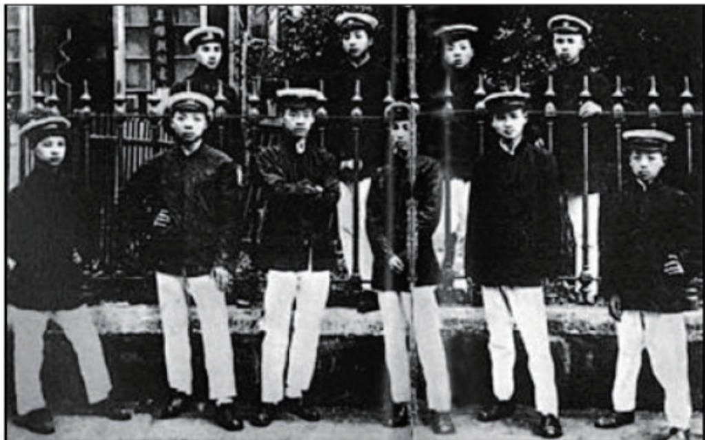
恽代英等人于五四运动前后，在湖北组织了互助社、利群书社和共存社。图为1918年6月19日互助社部分成员在武昌合影，前排左三为恽代英。