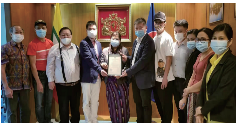
缅甸驻港总领事和两位副领事接见香港福建同乡会青年部一行 (7/5/2021)