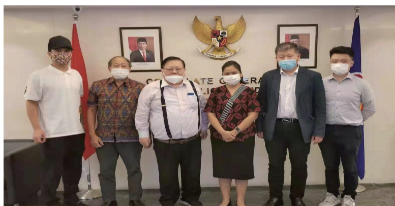
印尼驻港领事接见香港福建同乡会一行。(7/5/2021)