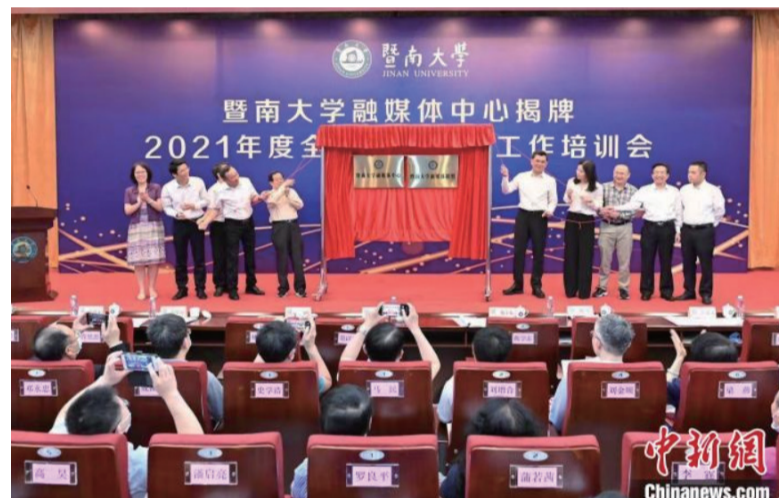
暨南大学融媒体中心揭牌成立

编辑、多种生成、多渠道推送、互动传播、舆情反馈”的信息生产传播机制,打造集网络文化建设、思政育人和资源互享的平台,不断提升学校声誉传播的影响力。(完)