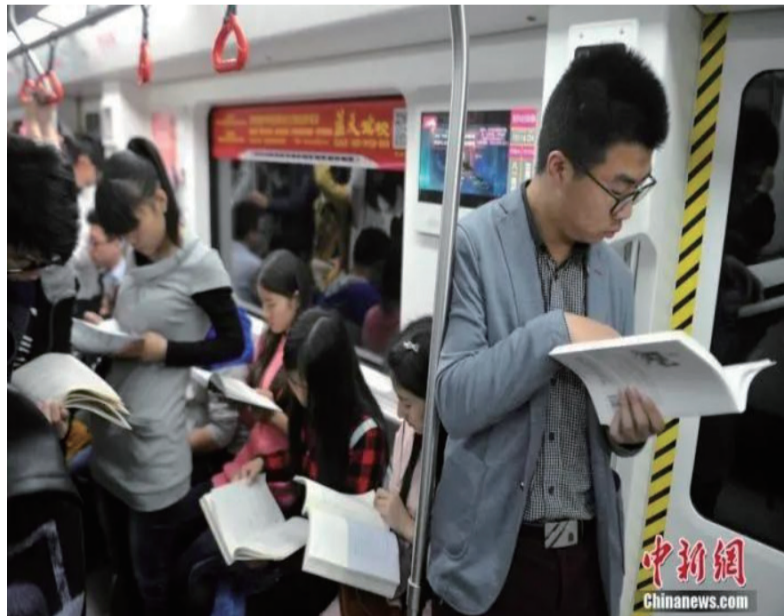
资料图：此前，来自南昌市7所高校的50余名年轻学生在地铁上共同阅读书籍。