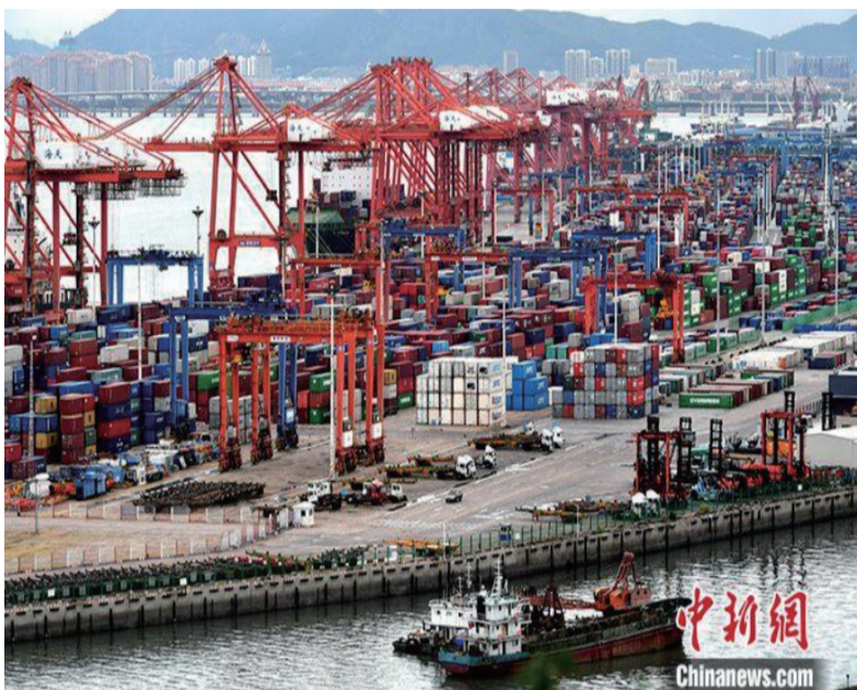
福建省厦门市东渡港。(资料图片)