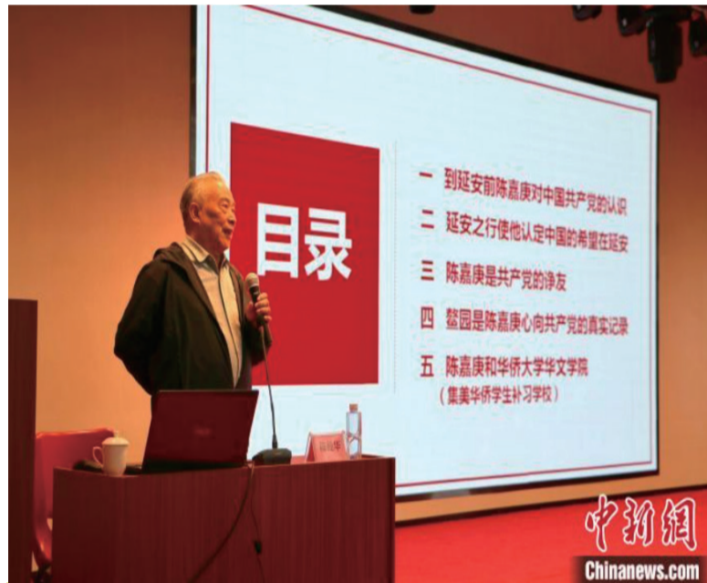
专题讲座。

华文学院相关负责人表示，后续将以“世界青年看中国百年”为主题，带领海内外青年了解中国共产党的百年历程。